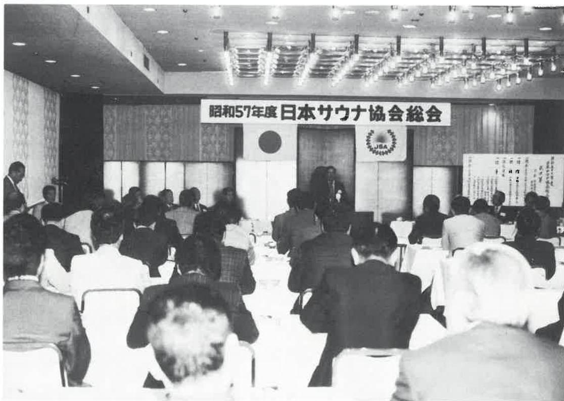
昭和57年度 総会風景

発行所 大阪市南区久郎右衛門町61番地 ニュージャパン観光(株)内 〒542 ☎(06)211-0463(直通) 発行人 中野幸雄 編集人 橘田吉平 支局・各県協会広報部