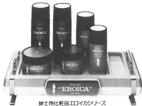
紳士用化粧品エロイカシリーズ

エロイカのあの独特の清涼感とまろやかさ、心にゆとりを生む気品ある香り。英雄は英雄を知るとか。エロイカは、あたくのサウナに一級のお客さまを呼ぶでしよう。